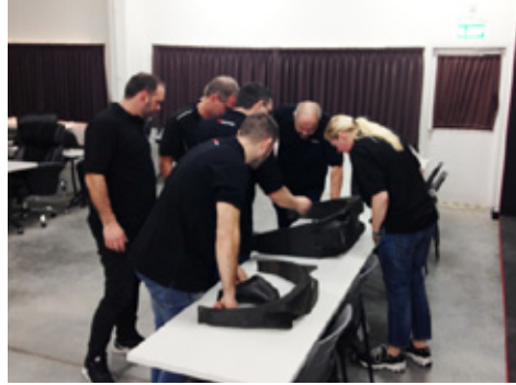
タイヤカットサンプルによる検品