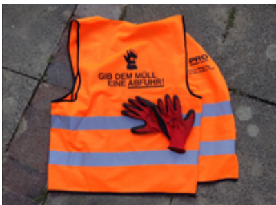
市から配布されたセーフティベストと手袋を着用して参加