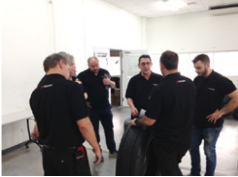
代理店向けアドバンストレーニング（クレームタイヤ検品）

る事でタイヤに対する知識・意識向上に努めたり、技術担当者向けにはさらなる知識習得を目指したアドバンストレーニングを実施したりして、意識向上に努めています。