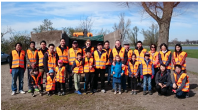
ライン川土手清掃活動への参加者

ライン川土手の清掃活動、デュッセルドルフ大学内の植樹園における環境保全活動などの地域密着型活動に継続的に参加することで、欧州に展開する企業としての社会的責任を果たすことを目指しています。今後も同様の活動を環境メンバー主導で定期的に行う予定です。