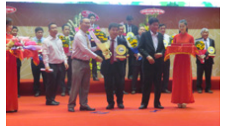
AWARD FROM GOVERNMENT

これらの活動が評価され、2017年度もビンズン省より優秀経営者として表彰されました。