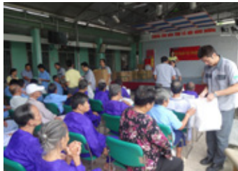
障がい者施設訪問

Forever Forestとして近隣小学校での植樹活動と環境教育を展開しています。2017年度は社内での植樹を優先し一時中断していましたが、2018年度より再開させる計画です。また、障がい者施設への訪問と物資の寄付を行いました。