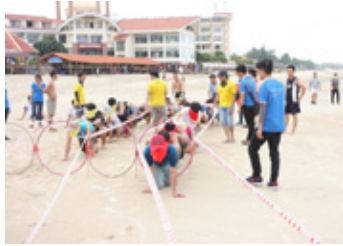
カンパニーツアー