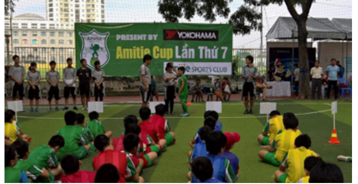
子ども向けサッカー教室

また、子ども向けサッカー教室に協賛する中で子どもたちへの安全啓蒙も実施しました。