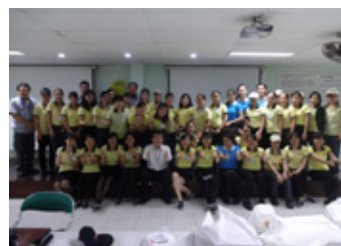
ベトナム婦人デー

2017年も3月の国際婦人デーと10月のベトナム婦人デーに労働組合と連携し、食事会や記念品授与などのイベントを企画しました。