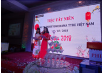
エンドイヤーパーティー

従業員とのコミュニケーションの強化を目的に、エンドイヤーパーティーやスポーツデー、ファミリーデー、カンパニーツアーなどさまざまな企画を実施しました。