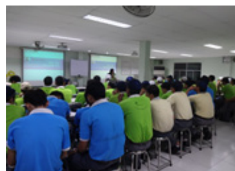
コンプライアンストレーニング

会議体の見直し、階層別の情報共有化と意思決定、効率的でローカル主導の運営を意識して取り組んでいます。