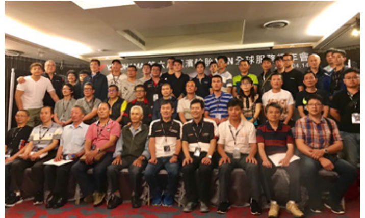
第6回全国YCN大会の集合写真

また、2018年4月14日に台湾・高雄市にて「第6回全国YCN大会」を開催し、2017年の各種活動への表彰式と2018年度の目標や新商品・販促などの説明を行いました。