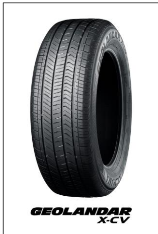
※画像は新型「ランドクルーザー250」の装着サイズとは異なります。

横浜ゴムは2024年度から2026年度までの新中期経営計画「Yokohama Transformation 2026（YX2026）」（ヨコハマ・トランスフォーメーション・ニーゼロニーロク）のタイヤ消費財戦略において高付加価値品比率の最大化を掲げています。その一環として、グローバルフラッグシップタイヤブランド「ADVAN（アドバン）」、SUV・ピックアップトラック用タイヤブランド「GEOLANDAR」の新車装着を推進しています。