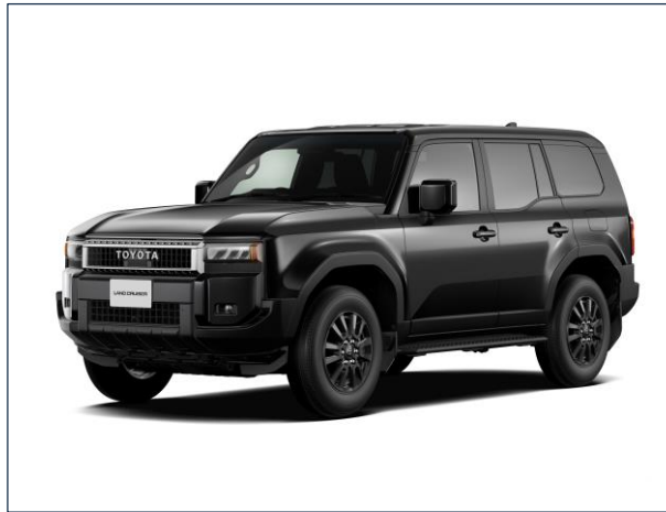
新型「ランドクルーザー250」