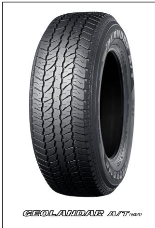
※画像のタイヤサイズは265/65R18 114V