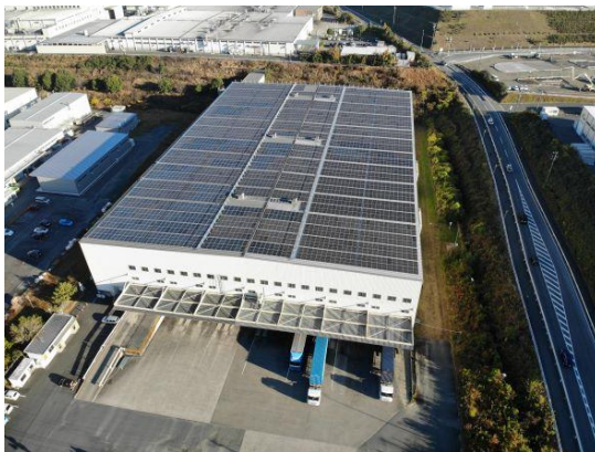
新城南工場内の屋根に設置した太陽光発電システム

カーボンニュートラルの実現に向けては「2050年にCO 2 排出量ネットゼロ」を目標に掲げています。その一環として、乗用車用ハイパフォーマンスタイヤを生産する主力工場である新城南工場を2030年までにCO 2 排出量がゼロの「カーボンニュートラルモデル工場」にすることを目指しており、太陽光発電システムや再エネ電力の活用、ボイラー燃料の天然ガスへの転換などを進めています。また、カーボンニュートラルに貢献するタイヤの生産を本格的に開始します。2030年以降は同工場で培ったノウハウを国内外の生産拠点に展開し、2050年までに全生産拠点のカーボンニュートラル化を計画しています。