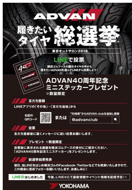
「ADVAN履きたいタイヤ総選挙」の告知