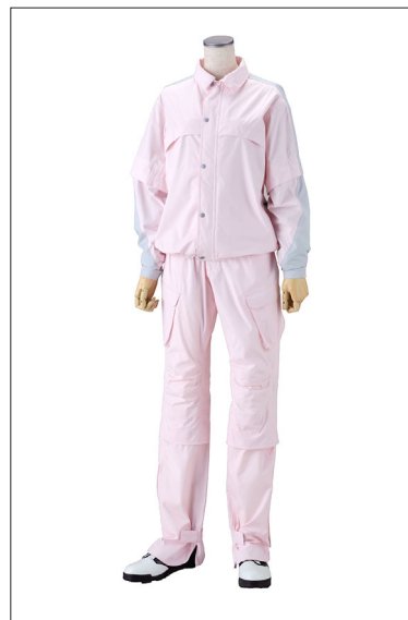
New RAIN COMPO レディース