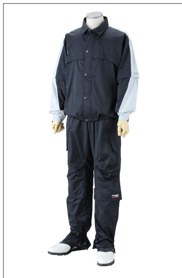
New RAIN COMPO メンズ

「RAIN COMPO」は、1989年の発売以来、高機能レインウェアの先駆けとして、多くのゴルファーから高い評価を得ている。全面リニューアルによって、ユーザーのプロギアブランドへの信頼性をさらに高めていく考え。