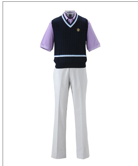
春のコーディネート例「洗練されたゴルフスタイル」

PRGR ウェアウェブカタログ http://www.prgr-wear.com