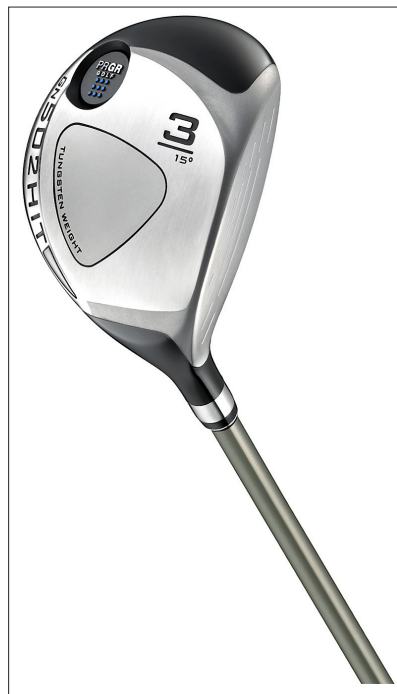
GN 502 HIT

「GN 502 銀」シリーズは「どんなゴルファーでも、カンタンに飛ばせるクラブ」をキーワードに開発されたPRGRブランドの主力モデル。GN 502 銀 HITは“見た目の安心感”をアピールするため思い切ったシャロー形状を採用、従来品（M 3 HIT 3W）に比べ6ミリシャローとした。シャロー形状に加え、薄肉軽量クラウンとソール部に配したタングステン合金で低重心化を図り、ボールの高打出しを実現。また従来品に比べて12gの軽量化（M-43、3Wの場合）、さらに一般的なフェアウェイウッドよりも、短かめのクラブ長さ（3W：42.5インチ）などによりミート率を高めた。またフェースにマレージング鋼を採用しボールの高初速化を実現すると共に、弾く打感が得られるフェアウェイウッドに仕上げた。