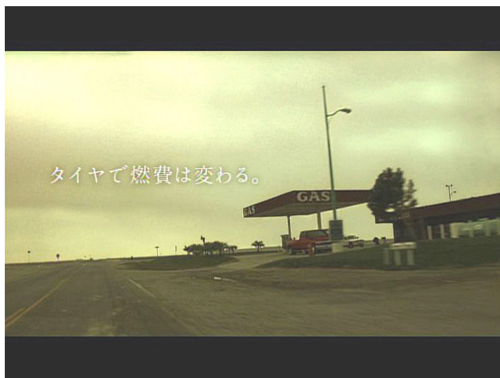
新テレビCMのワンシーン

エコタイヤ「DNA」は、「走り」「快適さ」というタイヤの基本性能を高めながら、タイヤのころがり抵抗を低減することで車の燃費向上に貢献する乗用車用タイヤシリーズ。1998年の発表以来、当社の主力商品として展開している。2007年にはころがり抵抗を従来品に比べ18%低減した「DNA dB super E-spec」やワンランク上の大型ミニバン専用タイヤ「DNA GRAND map」を発売する予定で、さらなるラインアップの充実を図る。