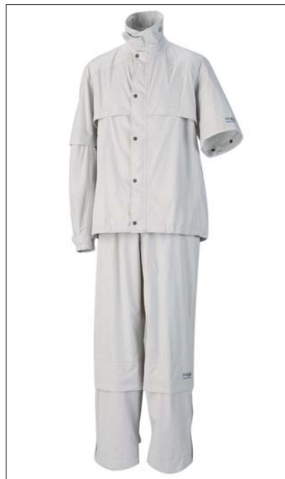
New RAIN COMPO

1989年の発売以来、雨の日の快適なプレーを追求して多くのゴルファーに好評を得てきたPRGR「RAIN COMPO」は、今回のフルモデルチェンジにより、動きやすく蒸れにくい、軽く静かな高機能レインウェアとしてさらに進化した。