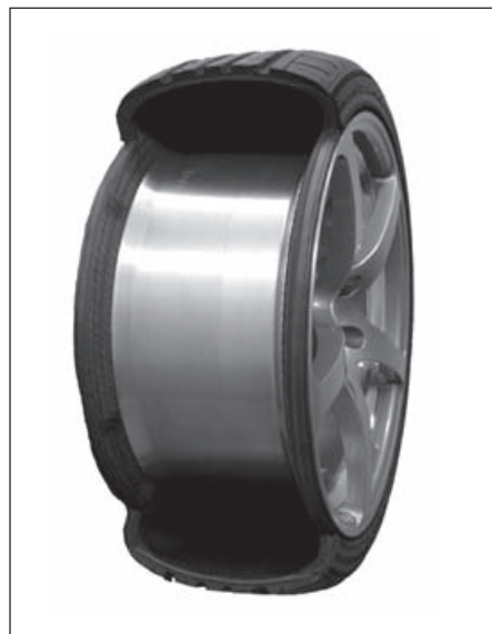
サイド補強型ランフラットタイヤ 「DNA dB EURO ZPS E550R」

なお、ランフラットタイヤはパンクしても気づきにくいいため、空気漏れを感知する空気圧警報装置との組み合わせが必須となる。このため、「DNA dB EURO ZPS」は標準でランフラットタイヤを装着している車両(タイヤ空気圧警報装置を設置済み)の補修用として販売する。