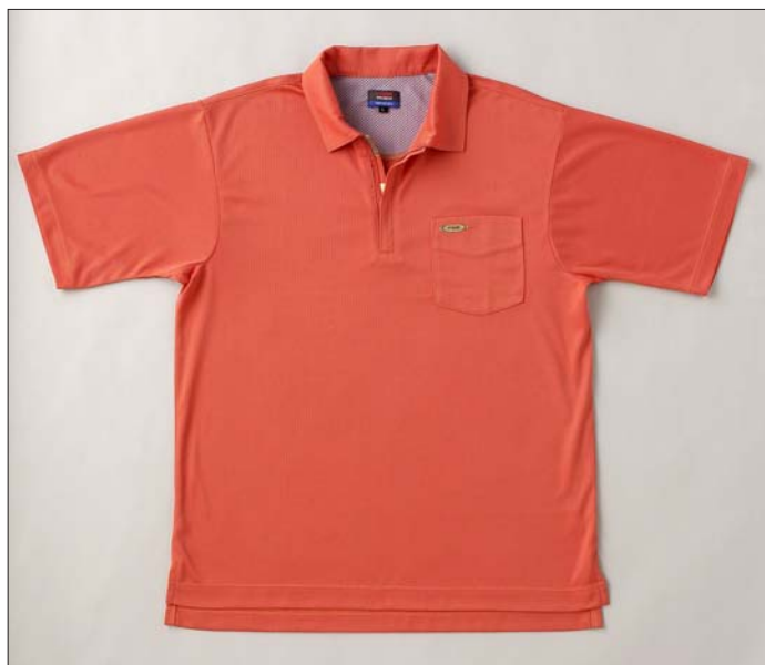
ジップ半袖ポロシャツ

なお、プロギア独自のコンセプトや商品ラインナップを紹介し、季節ごとにPRGRウェアの情報を提供する「PRGRウェアウェブカタログ」（ http://www.prgr-wear.com ）が開設されている。