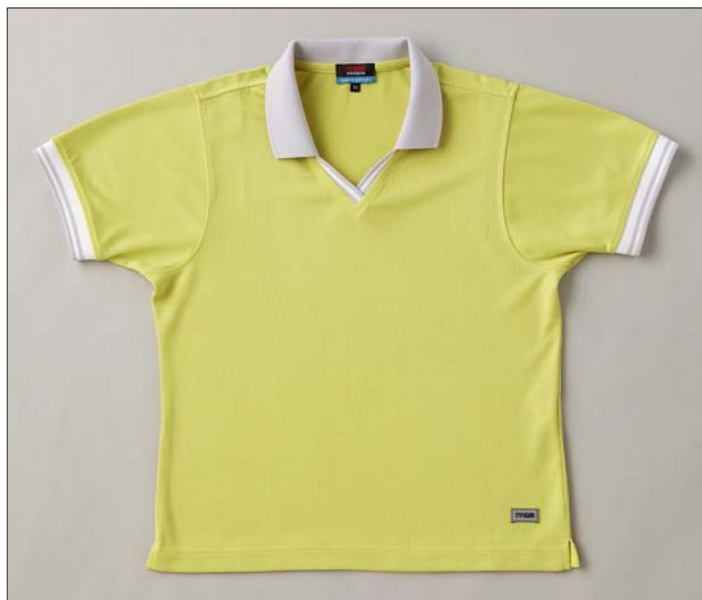
Vスキッパーポロシャツ

なお、プロギア独自のコンセプトや商品ラインナップを紹介し、季節ごとにPRGRウェアの情報を提供する「PRGRウェアウェブカタログ」（ http://www.prgr-wear.com ）が開設されている。