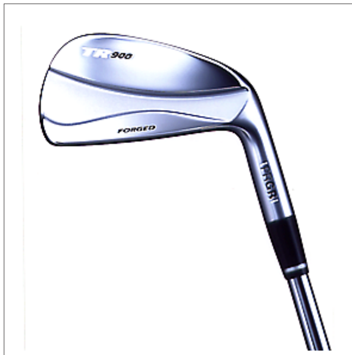
TR 900 FORGED

「TR 900 FORGED」は、高精度な軟鉄鍛造ヘッドで競技志向のゴルファーが求める構えやすい形状と最適重心設計を追求したアイアンセット。フェースミリング加工により平滑性を向上させたフェース面は、ボールに安定したスピン量をもたらす。また、バックフェースのグループの形状を進化させ、重心高さを全番手で19.5mmに統一した低重心設計とした。その結果、どのようなライでも重心ヒットが打ちやすくなった。さらに、上級者の打点位置に合わせた短い重心距離でコントロール性能を向上させた。