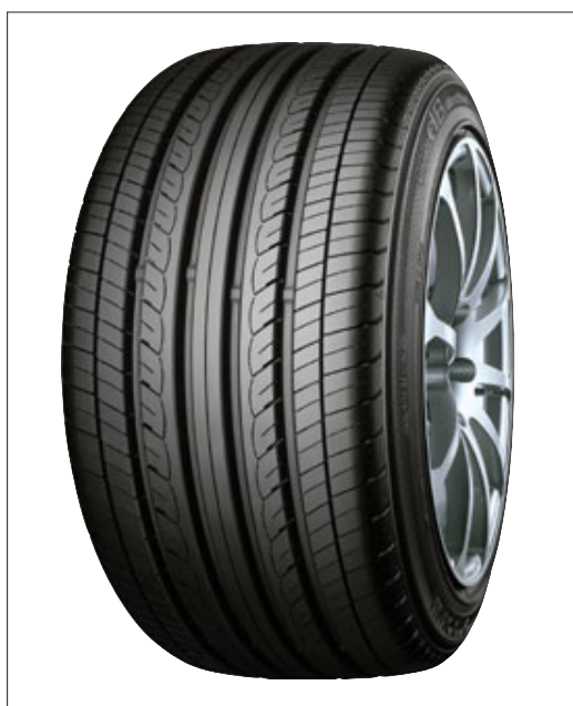
「DNA dB ES501」

「エコタイヤDNA」は運動性、安全性、快適性といったタイヤの基本性能を高めながら、ころがり抵抗を低減することで車の燃費を改善し、CO 2 の削減に貢献することをめざしたタイヤシリーズ。現在は高級輸入車用からミニバン専用タイヤまで幅広い車種に対応するラインナップが完成している。